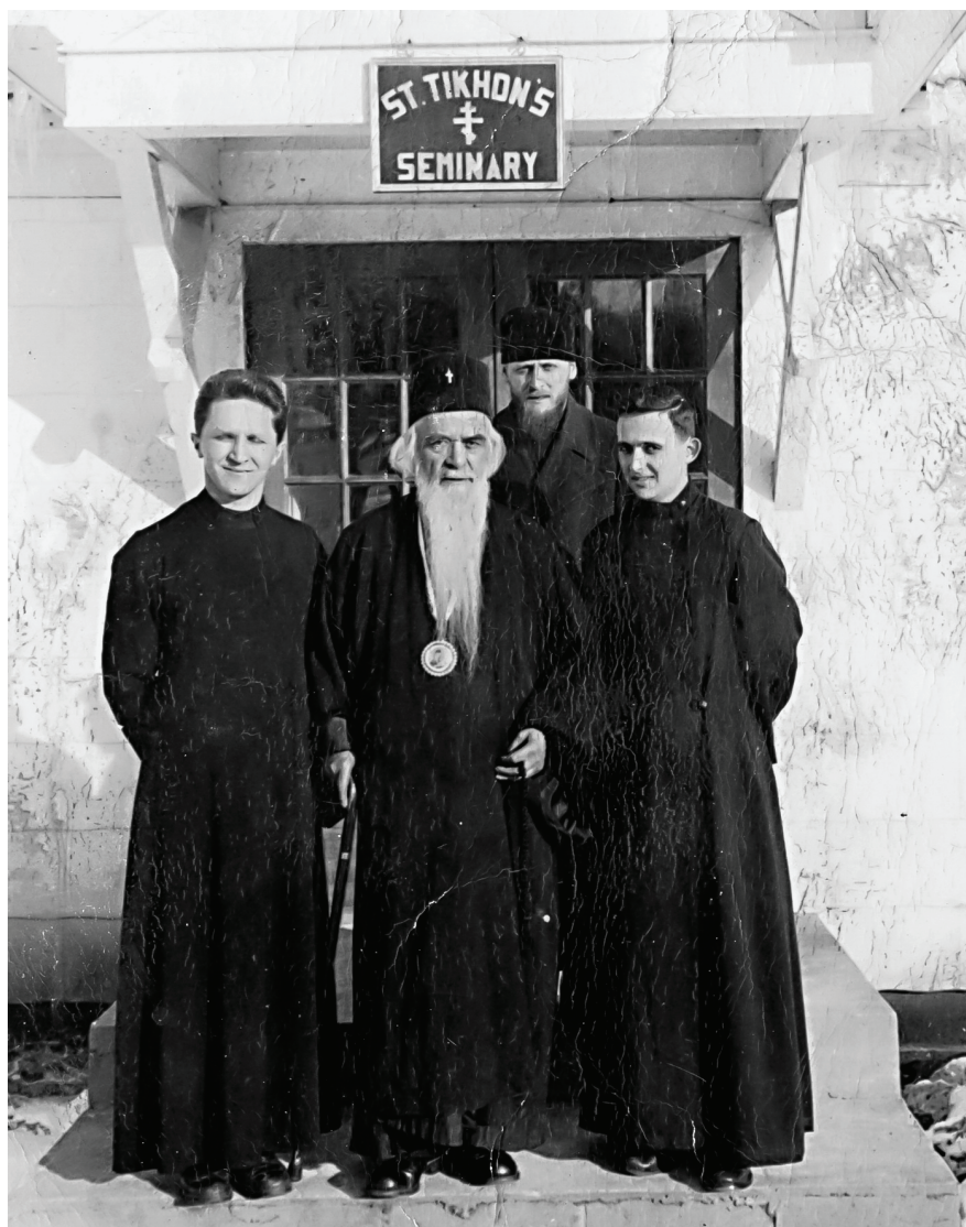
Figure 2. St. Nikolai Velimirovich at St. Tikhon's Seminary | Прилог 2. Св. Николај Велимировић у Семинарији Светог Тихона